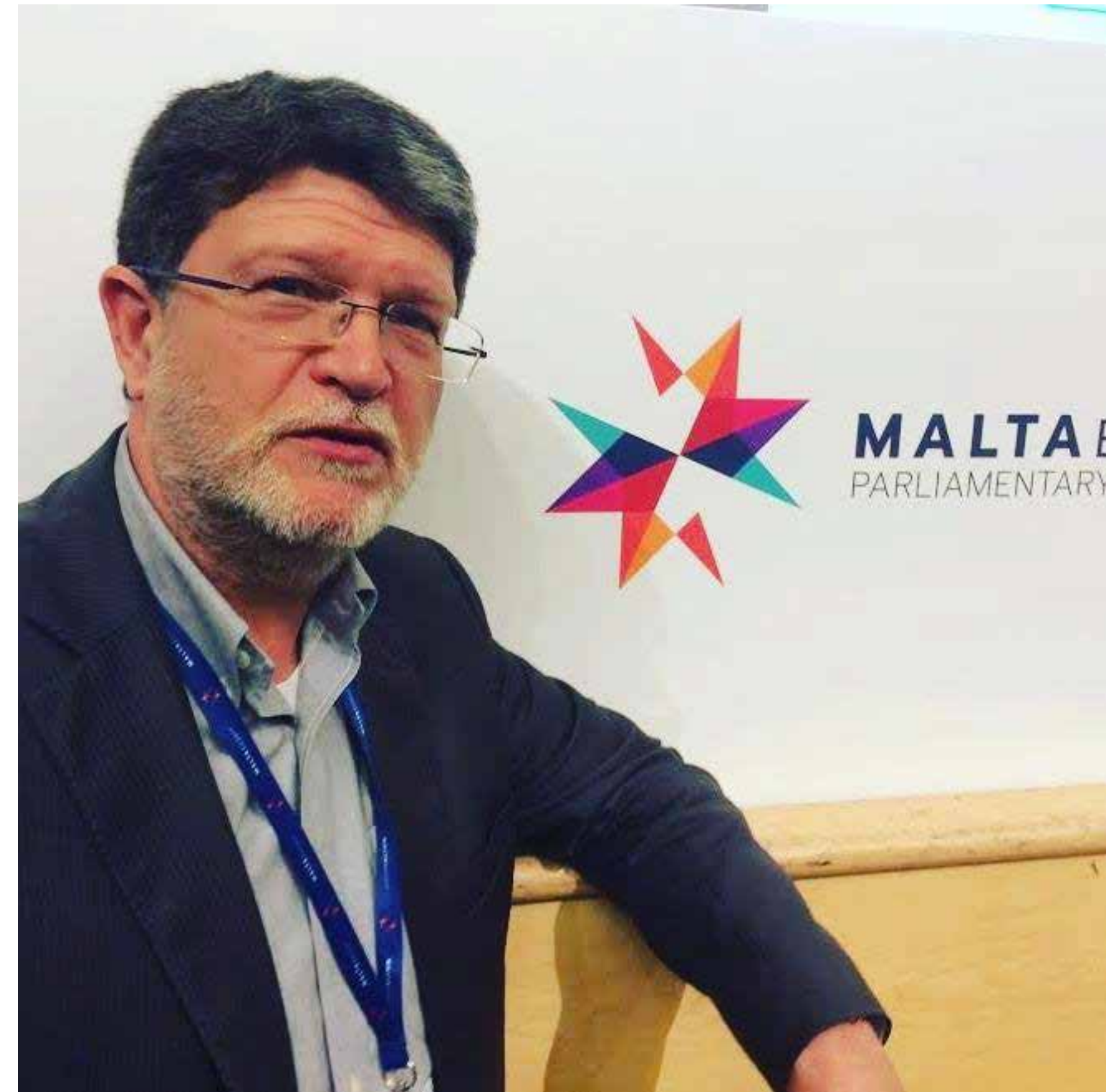
Međuparlamentarna konferencija za zajedničku vanjsku i sigurnosnu politiku te zajedničku sigurnosnu i obrambenu politiku MALTA, 26. - 28. TRAVNJA 2017.