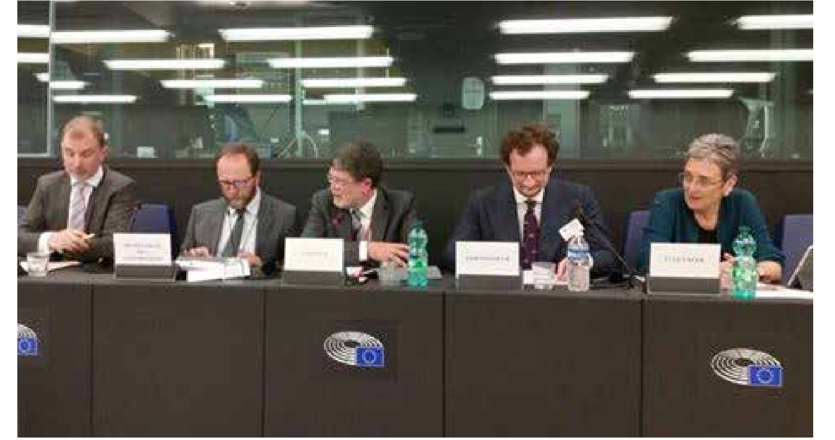
Delegacija Europskog parlamenta za odnose s BiH i Kosovom priprema se za sastanak zajedničkog Parlamentarnog odbora za stabilizaciju i pridruživanje EU-a i Kosova (SAPC) krajem travnja u Prištini STRASBOURG, 5. TRAVNJA 2017.