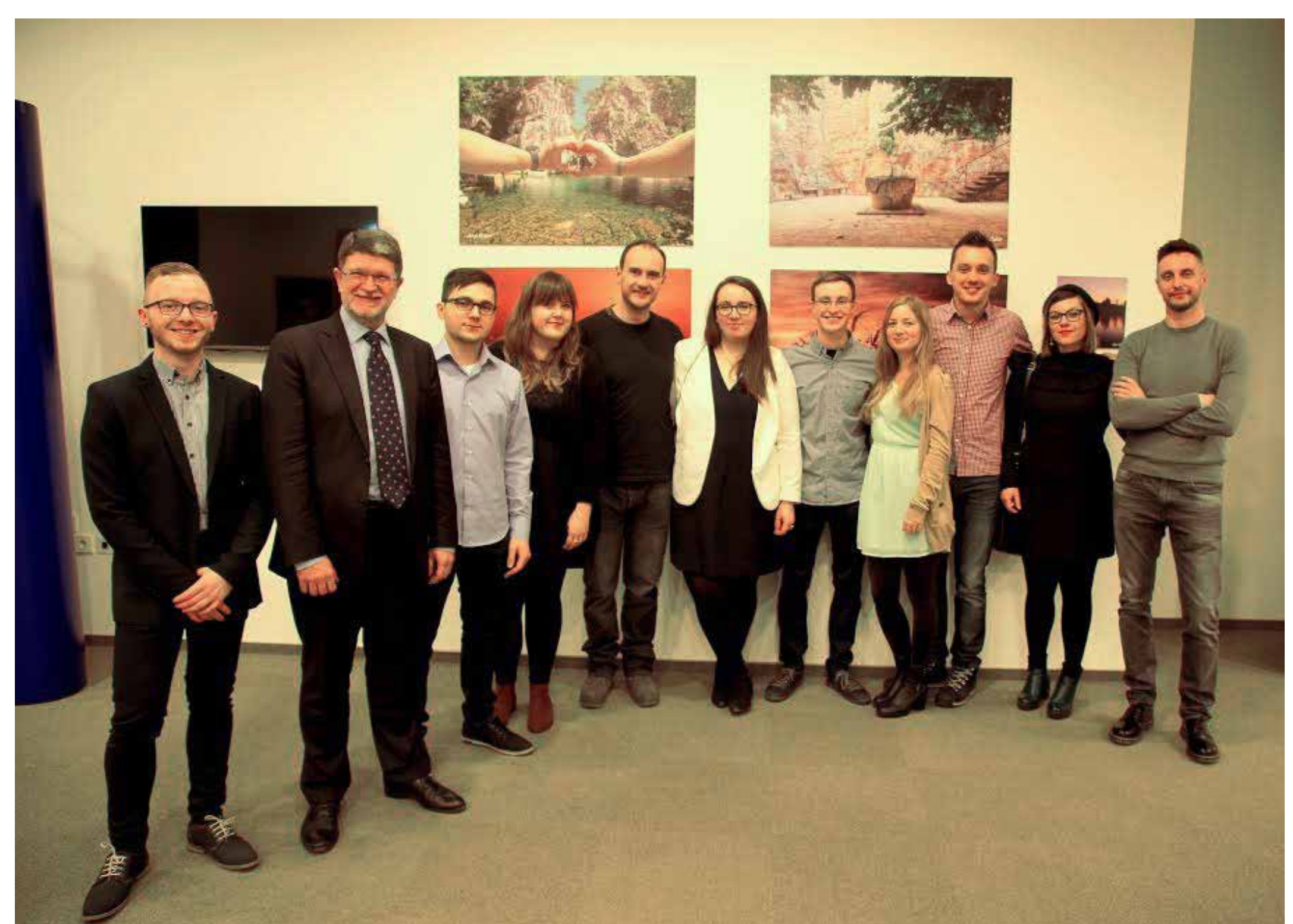
Izložba pobjedničkih fotografija kreativnog foto natječaja „Klik za bolju Hrvatsku vol.2“ Kuća Europe, ZAGREB, 27. SIJEČNJA 2017.