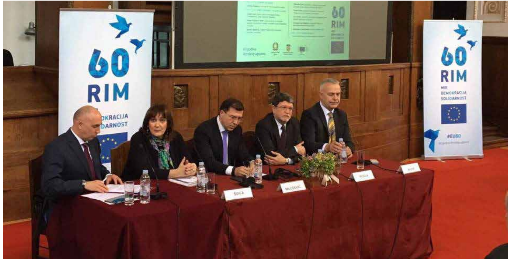
Konferencija povodom 60 godina od Rimskih ugovora „Budućnost EU: postignuća, izazovi, perspektive“ ZAGREB, 22. OŽUJKA 2017.