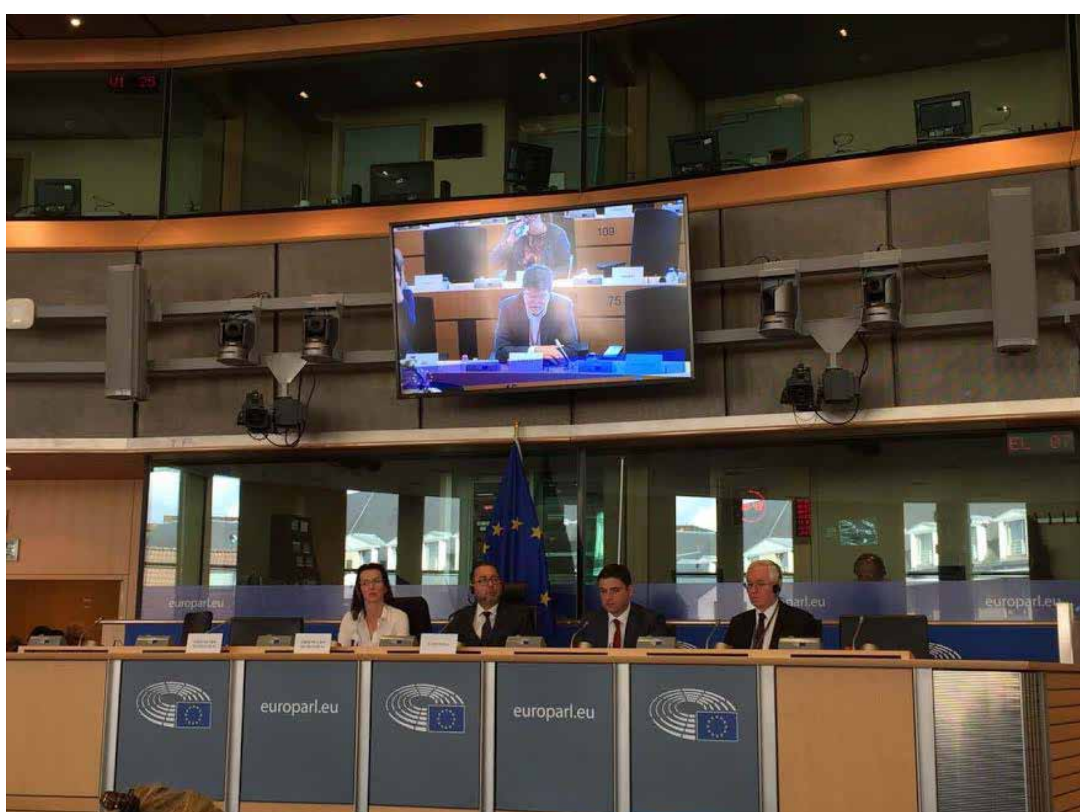
Predsjednik SDP-a Davor Bernardić i predstavnici zagrebačkih mjesnih organizacija u posjetu zastupniku Piculi - sastanak i nastupni posjet predsjednika Bernardića pred S&D grupom u Europskom parlamentu BRUXELLES, 26. TRAVNJA 2017.