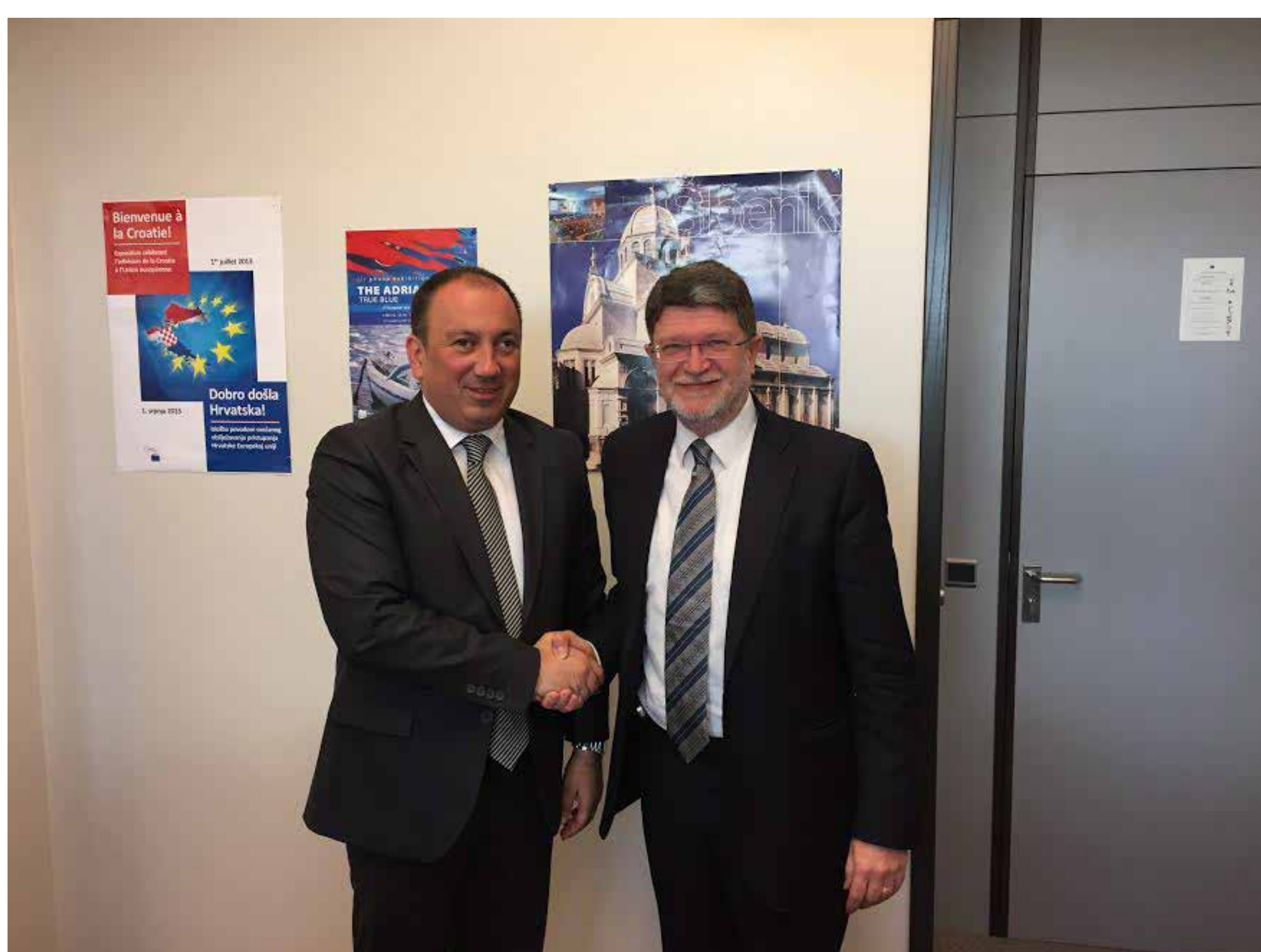
Sastanak s ministrom vanjskih poslova BiH Igorom Crnadakom BRUXELLES, 11. TRAVNJA 2017.

Europski parlament je 15. veljače, s uvjerljivom većinom od 496 glasova, usvojio Izvješće o Bosni i Hercegovini u 2016. godini.