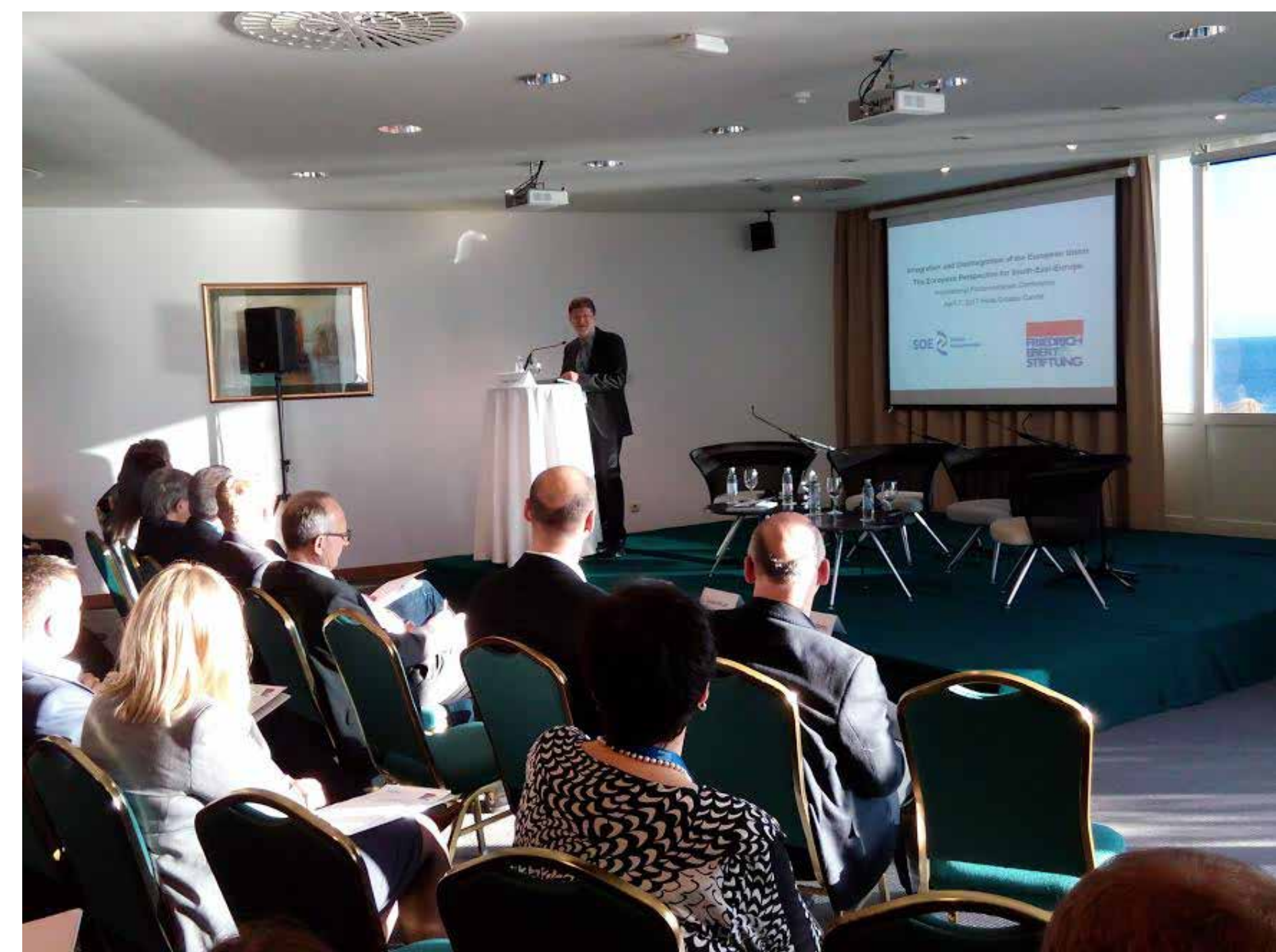
Međunarodna konferencija o situaciji na jugoistoku Europe u organizaciji Zaklade Friedrich Ebert CAVTAT, 8. TRAVNJA 2017.