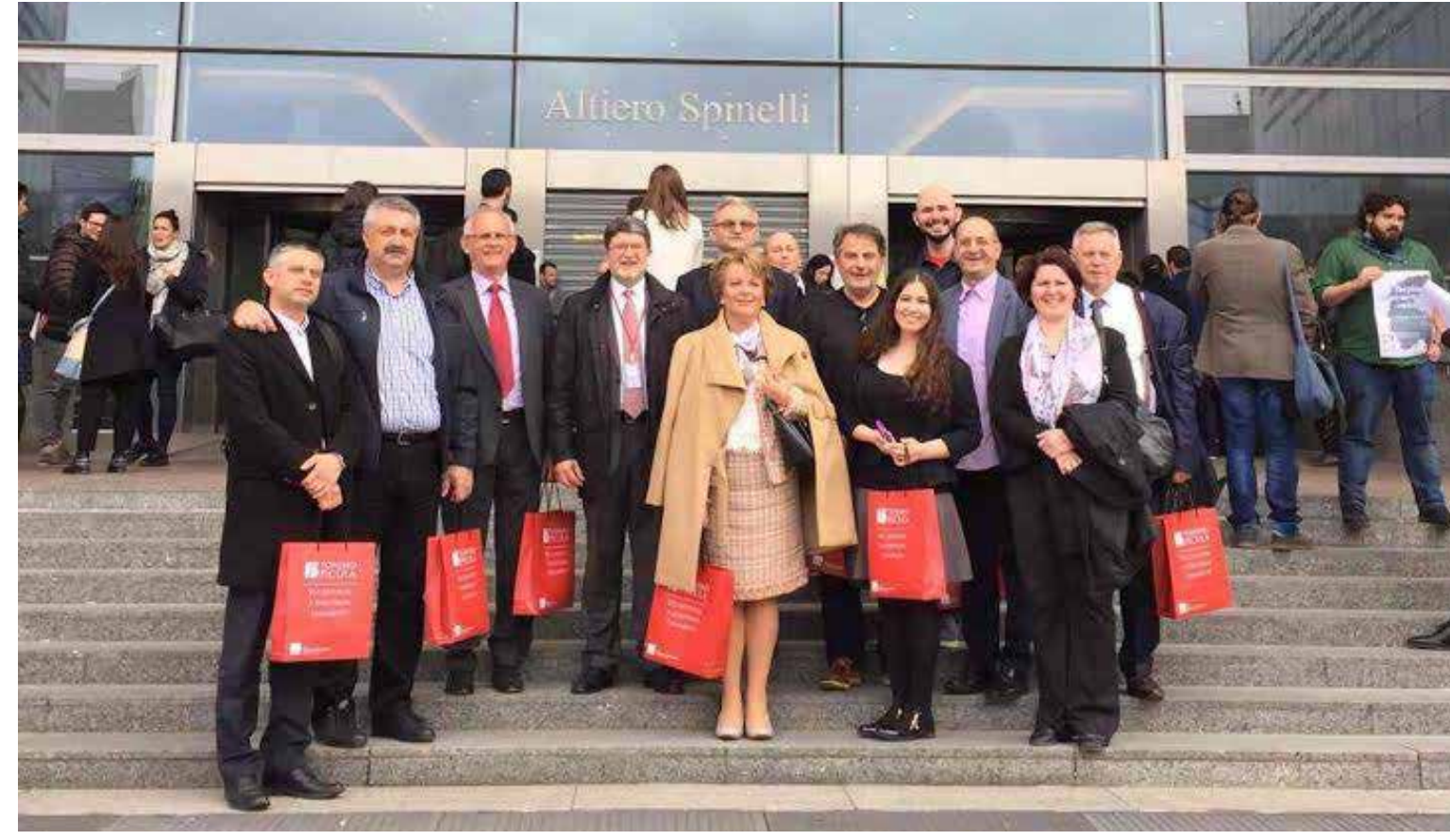
Grupa SDP-ovaca iz cijele Hrvatske u posjetu Piculi BRUXELLES, 28- 30. OŽUJKA 2017.