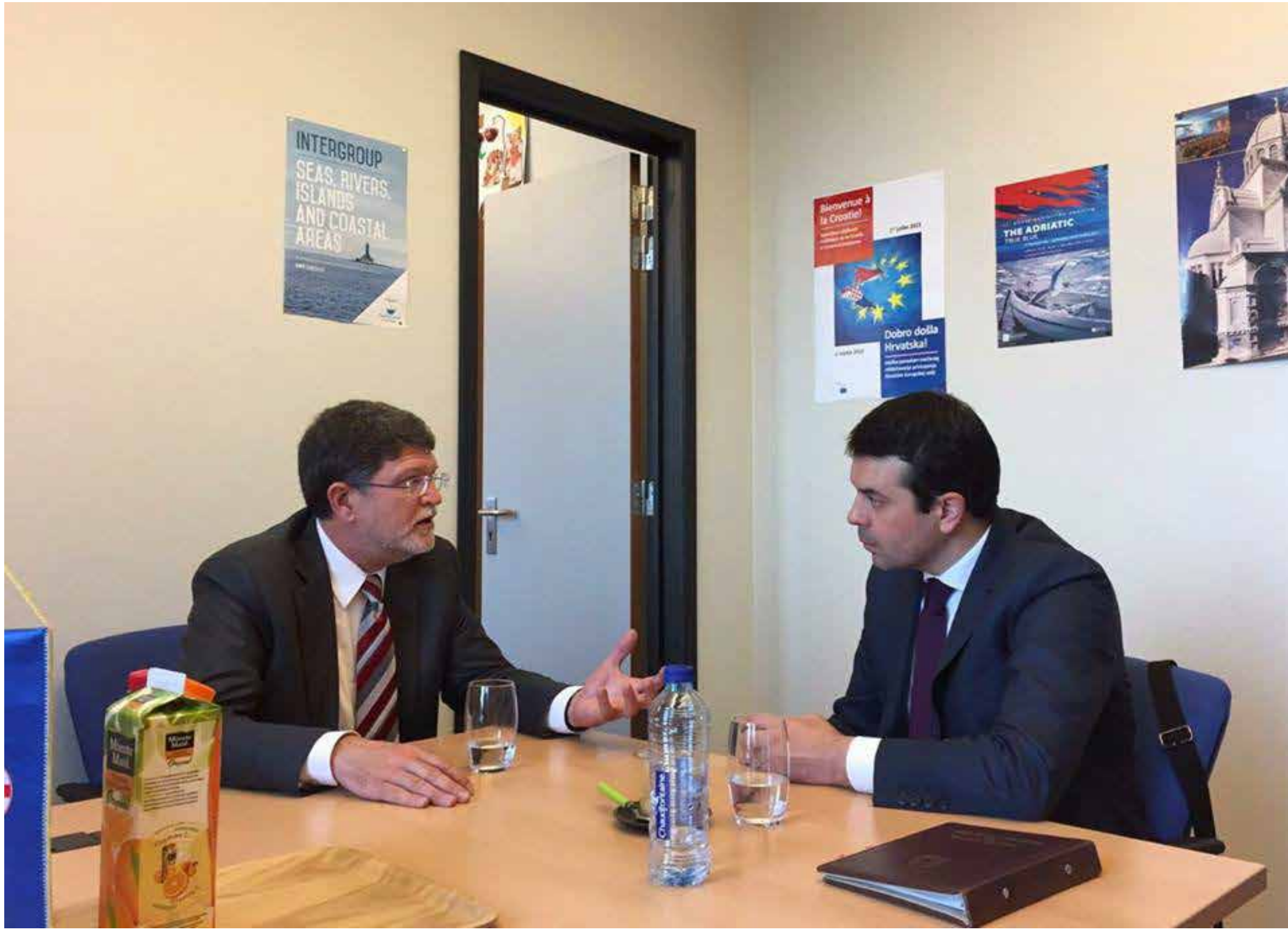
Drugi sastanak s ministrom vanjskih poslova Makedonije Nikolom Poposkim o trenutnoj političkoj situaciji u Makedoniji 26. TRAVNJA 2017.