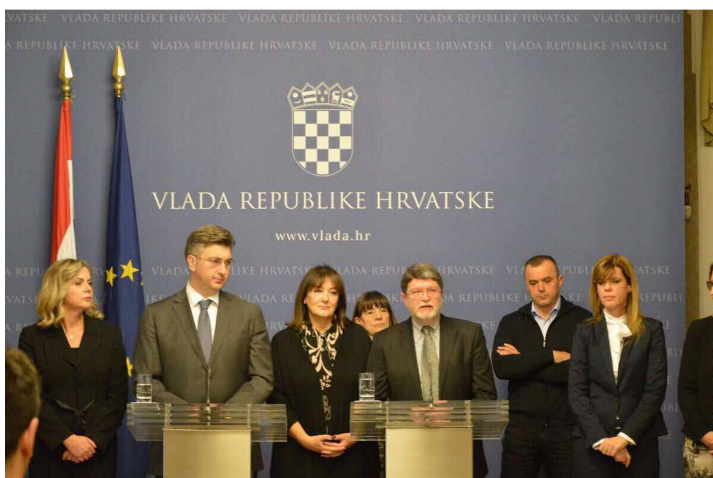
Prvi sastanak hrvatskih zastupnika s premijerom Plenkovićem o suradnji na pitanjima od nacionalnog interesa ZAGREB, 4. SIJEČNJA 2017.